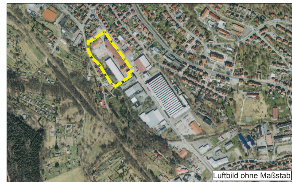
Luftbild ohne Maßstab