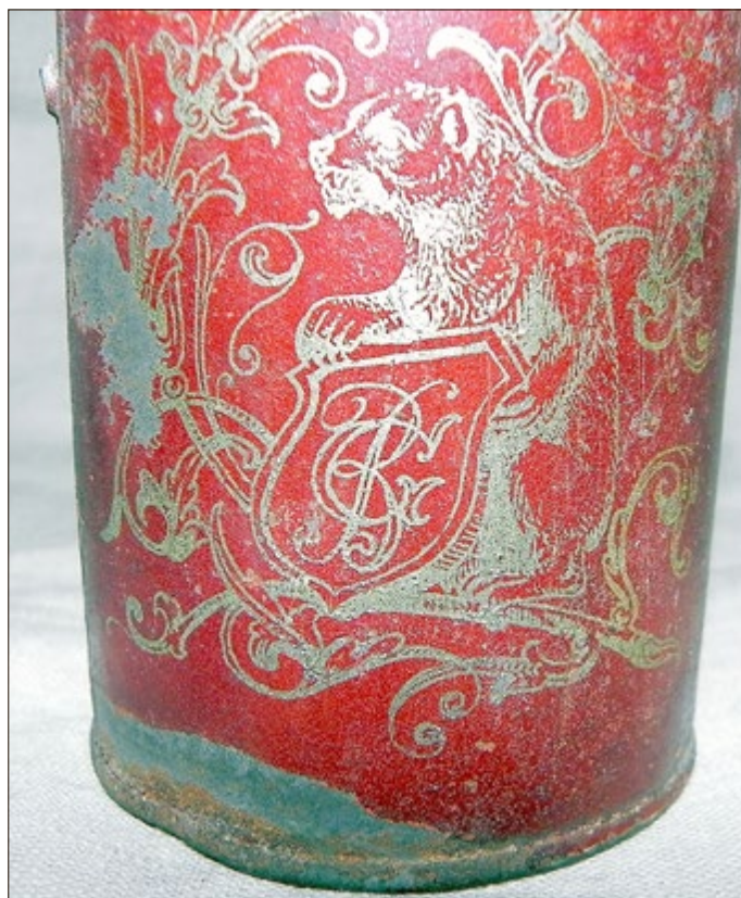
GB – Signatur der Spielwarenfabrik Gebrüder Bing

Eine Besonderheit unserer Eismaschine ist ihre Größe. Während normale Eisbüchsen ca. 40 cm hoch waren, misst unsere Maschine insgesamt nur 14 cm. Recherchen auch der verschlungenen Beschriftung der Rückseite „GB“ zeigen, es handelt sich um ein Kinderspielzeug der Gebrüder Bing.