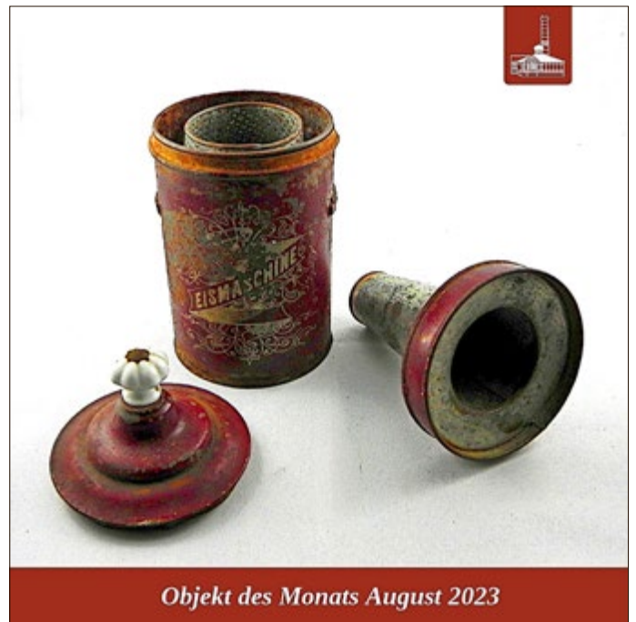
Objekt des Monats August 2023

Der Sommer neigt sich dem Ende zu, die Ferien sind vorüber. Ein beliebter Genuss der heißen Jahreszeit bleibt uns aber erhalten: Speiseeis. Heute ganzjährig verfügbar, war es ein Jahrhundert früher ein Luxusgut, dessen Herstellung sich - gerade im Sommer - aufwendig gestaltete.