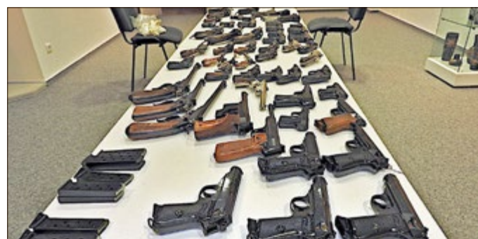
Übernahme der Waffensammlung aus Schenkung