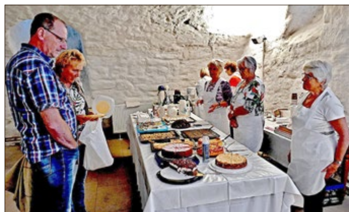
Kuchenbasar zum Tag des offenen Denkmals in Benshausen