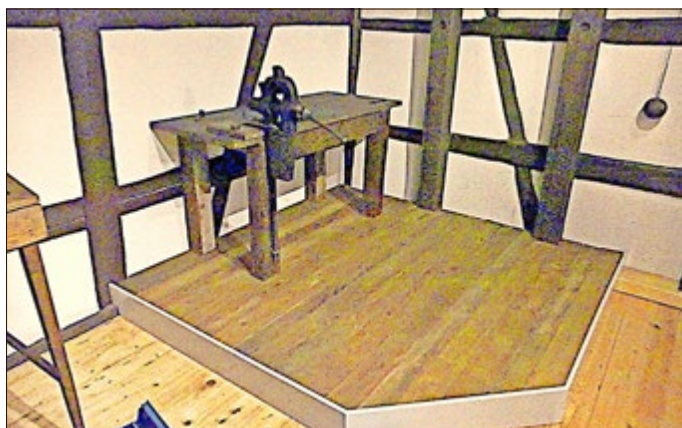
Neugestaltung der Büchsemacherwerkstatt