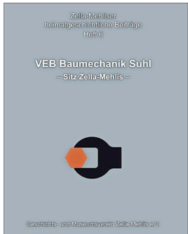
Das sechste Heft aus der heimatgeschichtlichen Reihe