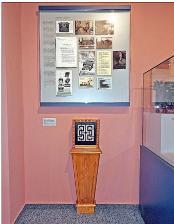
Hörstation in der Büromaschinenausstellung