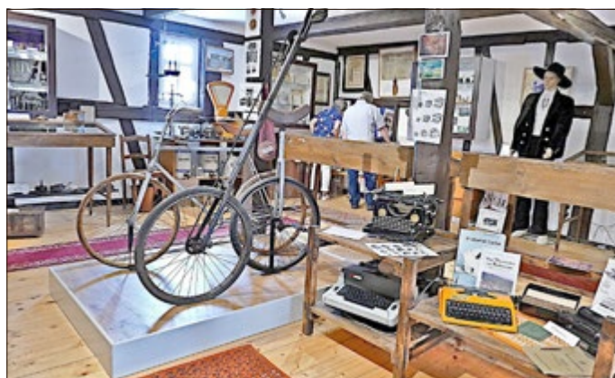
Der Ausstellungsbereich zum Radsport in Benshausen, hier noch ohne die neuen Informationstafeln.