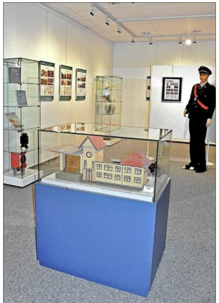
Blick in die Sonderausstellung „Zug um Zug“

Besonders sei auch auf die aktuelle Ausstellung „Zug um Zug“ hingewiesen. In der Zeit von 13 bis 16 Uhr wird der Eisenbahnenthusiast Bernd Reißig durch die Sonderausstellung führen und für alle Fragen rund um die Eisenbahn zur Verfügung stehen.