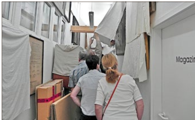
Ein Blick hinter die sonst verschlossenen Türen des Stadtmuseum lohnt immer!

Im Stadtmuseum in der Beschußanstalt finden an beiden Tagen, zu festgelegten Zeiten, besondere Führungen hinter den Kulissen statt. Unter dem Motto „Was machen Die eigentlich, wenn keine Besucher da sind?“ bieten die Mitarbeiter des Museums einen Rundgang durch Arbeitsräume und Depots - für Jeden! Treffpunkt und Start ist Samstag und Sonntag jeweils um 11.00 Uhr und 14.00 Uhr am Empfangstresen im Foyer. Die Anzahl der Teilnehmer an diesen Führungen ist limitiert (max. 15 Personen), daher wird an den beiden Tagen eine Liste am Tresen ausliegen, in die sich Interessenten eintragen können.