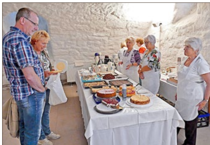
Ein leckeres Kuchenangebot erwartet die Gäste in Benshausen.

Die Ausstellung „Daniel Elster - Musikprofessor aus Benshausen“ wartet ebenfalls darauf, an diesem Tag in aller Ruhe angeschaut zu werden. Hier konnte die Beleuchtung durch die Installation neuer Strahler erheblich verbessert werden. Ein Angebot an Kaffee und Kuchen rundet am Nachmittag den Besuch ab.