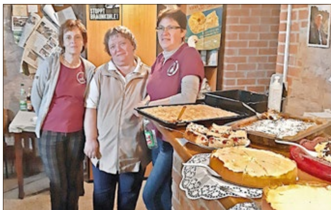
Beste Versorgung erwartet die Besucher in der „Kellerwirtschaft“.

Zu einem musikalischen Mitmach-Abend lädt der Museumsverein am Samstag ab 18.00 Uhr in die „Kellerwirtschaft“ (neue „Rhöntropfengrotte“ im Keller des Stadtmuseums) ein. Die Gäste sind zum Mitsingen und -musizieren, gerne auch mit eigenen Instrumenten, eingeladen.