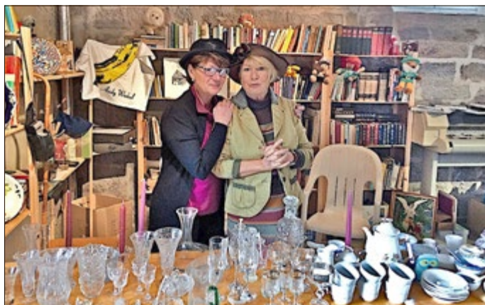
Das bewährte Flohmarkt-Team erwartet die Kundschaft.

Kinder und ihre Angehörigen können bei einer kleinen Museumsrallye gemeinsam mit „Burni“, dem ältesten Artefakt des Museums, auf Entdeckungsreise durch die Ausstellungen des Stadtmuseums in der Beschußanstalt gehen und am Ende sogar einen kleinen Preis gewinnen.