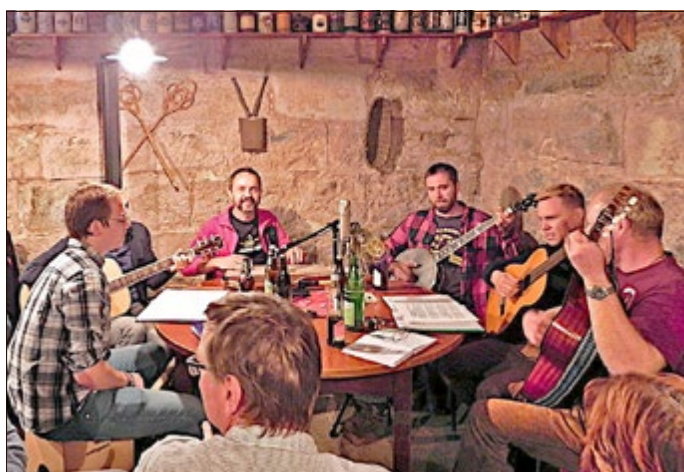
Musikalische Umrahmung des Abends in der Kellerwirtschaft mit Musikern aus der Region.

Zu einem musikalischen Mitmach-Abend lädt der Museumsverein am Samstag ab 18.00 Uhr in die „Kellerwirtschaft“ (neue „Rhöntropfengrotte“ im Keller des Stadtmuseums) ein. Die Gäste sind zum Mitsingen und -musizieren, gerne auch mit eigenen Instrumenten, eingeladen.