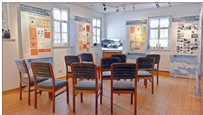
Blick in die Ausstellung zur Industriegeschichte der Stadt.

Dies ist auch eine gute Gelegenheit zum Besuch der Ausstellung „Industriegeschichte Zella-Mehlis“ wo der Film: „Historisch gewachsene Wirtschaftskraft“ angeschaut werden kann.