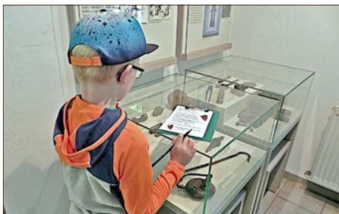
Mit dem „Schmiedehannes“ durch das Technikmuseum.

Auch im Technikmuseum Gesenkschmiede sind Familien herzlich eingeladen bei einer Museumsrallye, gemeinsam mit dem „Schmiedehannes“, dem Schmiede-Maskottchen, auf Erkundungstour zu gehen, hier gibt es ebenfalls am Ende einen kleinen Preis zu gewinnen.