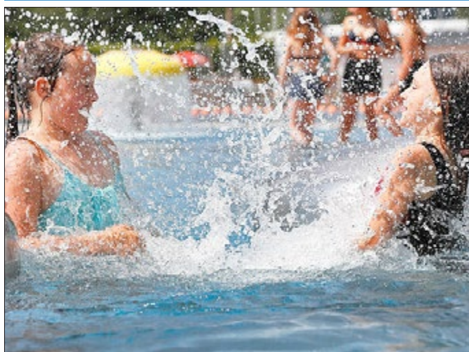
Badespaß im Freibad „Einsiedel“.

Mit ein bisschen Verspätung hat nun auch die Freibadsaison im Freibad „Einsiedel“ begonnen. Grund für die leichte Verzögerung war der Defekt der Pumpe, die das Quellwasser ins Freibad pumpt. Sie wurde jedoch zum Glück kurzfristig vom Unternehmen Pumpentechnik Ansorg geliefert und vom Unternehmen Matthias Langenhan Haustechnik ersetzt und neu angeschlossen, so dass der Badespaß nun starten konnte.