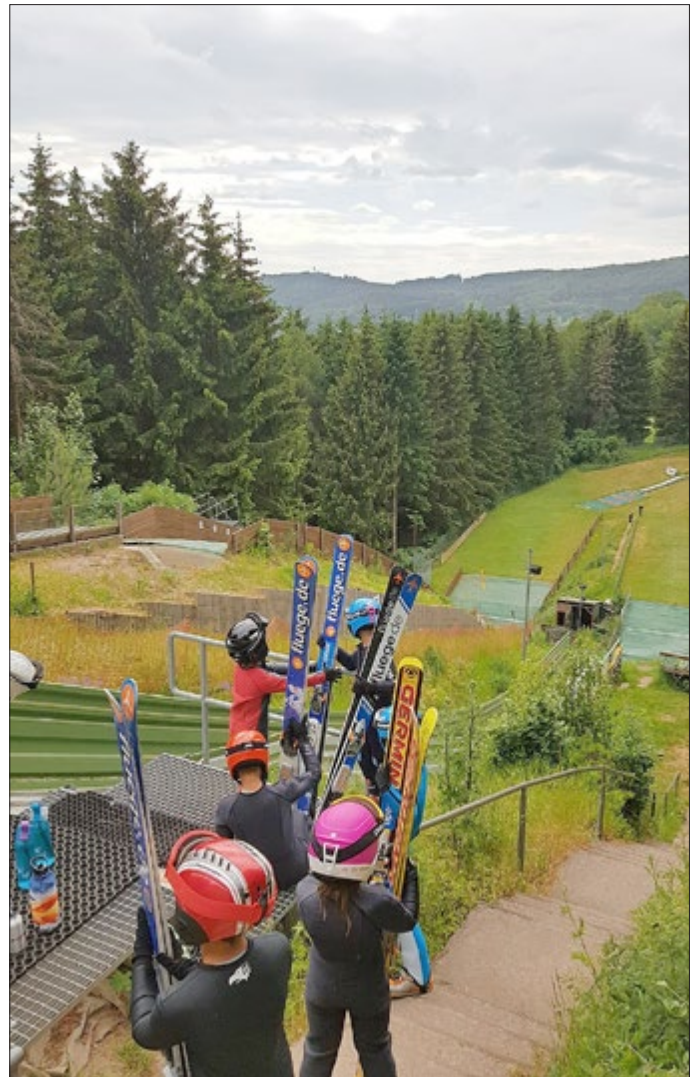
Ferienfreizeit des SC „Motor“, Nordische Kombination.

mit bundesweitem Teilnehmerkreis werden, falls der SC „Motor“ die Zusage erhält, mit 1000 Euro unterstützt. 2000 Euro erhält der Gesangverein 1980 Zella-Mehlis für die Vorbereitung seines Adventskonzerts. Hier waren Kosten für zwei Probenwochenenden und die Heizung der Kirche entstanden. Auch die 2. Rallye Natur, zu der die Ortsgruppe des NABU am kommenden Samstag einlädt, wird von der Stadt mit 600 Euro unterstützt. Außerdem erhält der TSV Zella-Mehlis knapp 1000 Euro für den schon traditionellen Jugendaustausch mit Milevsko in Südböhmen.