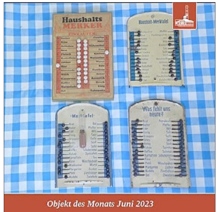
Objekt des Monats Juni 2023

Ein kluger Erfinder hat sich die Tafeln sogar als D.R.G.M., d. h. als „Deutsches Reichs-Gebrauchsmuster“, dem „kleinen Bruder“ des Patents, schützen lassen.