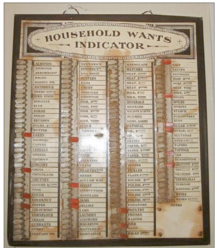
Umfangreiche englische Merktafel, um 1920

Eine zeitgenössische Tafel, vor wenigen Jahren erhältlich, funktioniert wie ehemals, hat jedoch ein deutlich anderes Produktspek-