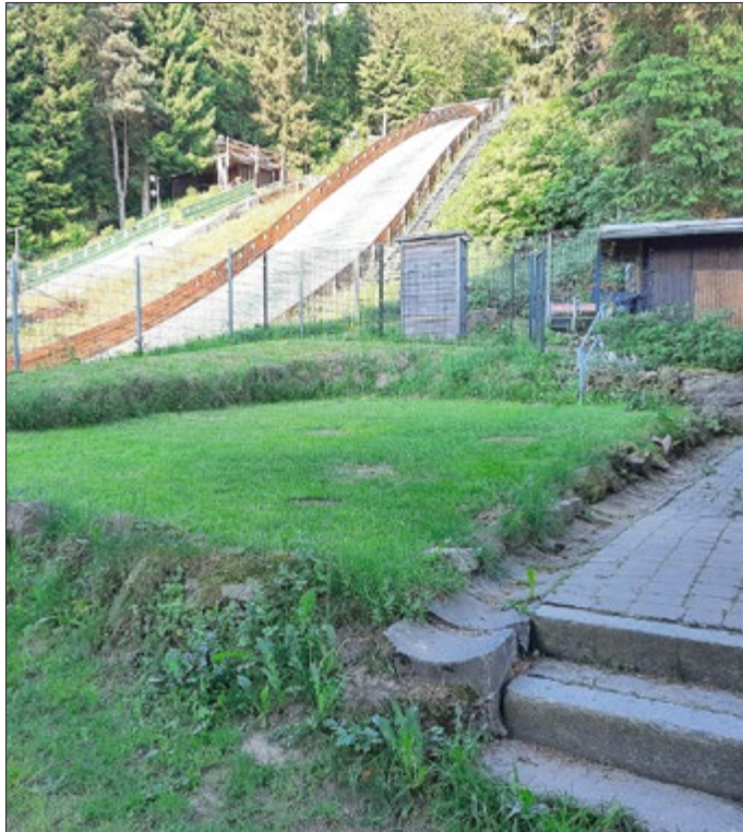
Hier will die Bergwacht die Natursteinmauer erneuern. Auch dafür hat der Sozialausschuss eine Unterstützung bewilligt.

Frühlings-, Sommer- und Herbstfest. Geld bekommt auch die Bergwacht. Die ehrenamtlichen Mitglieder des DRK-Kreisverbands planen die Mauer an der Bergwacht-Hütte zu erneuern.