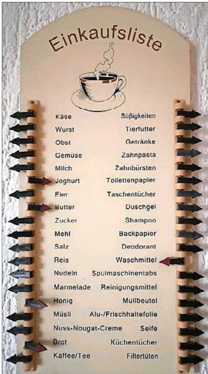
Moderne Einkaufstafel aus Holz mit Plastikmerkern, um 2015

Was würden diese Tafeln heute noch enthalten: Pizza, Tiefkühlware, Cola, Limonaden, Ketchup etc.? Viele verarbeitete Lebensmittel. Die alten Tafeln spiegeln sicherlich auch das - überschaubare - Warenangebot der damaligen Zeit wider. Eine Tafel von heute würde mit 40 Artikeln nicht leicht auskommen. Es gab Haferflocken und nicht zehn Sorten Müsli und diese noch von je sieben verschiedenen Herstellern, Cornflakes und Frühstückszerealien gar nicht mitgezählt. Gewaschen wurde sich mit Seife, 60 Arten Shampoo für jeden möglichen Haartyp in bunten Plastikflaschen gab es nicht.