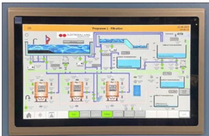
... sowie die Visualisierung im Freibad „Friedrich Ludwig Jahn“.

Vor Saisonstart haben noch andere Arbeiten an den beiden gut ausgestatteten und sehr beliebten städtischen Freibädern stattgefunden. So war es erforderlich, im Freibad Benshausen die Komponenten für Mess- und Regeltechnik zu erneuern. Diese Geräte überwachen und steuern die Aufbereitung des Schwimmbadwassers hinsichtlich der entsprechenden Hygieneanforderungen und -parameter. Daran entscheidet sich, wann dem Wasser Chlor hinzugefügt wird bzw. ob es zusätzlich gefiltert und weiter behandelt werden muss. Die bisherige Technik war bereits mehr als 20 Jahre alt. Die Ersatzteilversorgung konnte seitens des Herstellers und der Wartungsfirma nicht mehr gesichert werden. Der Austausch der neuen Mess- und Regelgeräte konnte jedoch nur in Kombination mit dem Einbau einer neuen Steuerung der Badewassertechnik erfolgen. Die Maßnahme wurde im vergangenen Herbst begonnen und rechtzeitig vor Saisonbeginn abgeschlossen. Die Steuerung erfolgt wiederum mittels einer Visualisierung. Hier können die Fachkräfte für Bäderbetrieb die Werte nicht nur ablesen und überwachen, sondern auch unmittelbar Nachsteuerungen außerhalb des Technikraumes vornehmen. Nicht nur die Technik wurde modernisiert, so zielt das schwungvoll gestaltete Logo des Freibad „Friedrich-Ludwig-Jahn“ seit dieser Saison die Ansicht zur Straße.