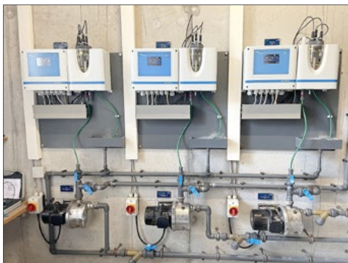
Die neue Mess- und Regeltechnik ...

Mit ein bisschen Verspätung hat nun auch die Freibadsaison im Freibad „Einsiedel“ begonnen. Grund für die leichte Verzögerung war der Defekt der Pumpe, die das Quellwasser ins Freibad pumpt. Sie wurde jedoch zum Glück kurzfristig vom Unternehmen Pumpentechnik Ansorg geliefert und vom Unternehmen Matthias Langenhan Haustechnik ersetzt und neu angeschlossen, so dass der Badespaß nun starten konnte.