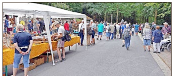
Buntes Treiben am Flohmarkt rund um das Schmiedefest

Unbedingt einen Besuch wert ist auch die Ausstellung zur Industriegeschichte von Zella-Mehlis mit dem spannenden Film: „Zella-Mehlis - Historisch gewachsene Wirtschaftskraft“, an dessen Ende jeder weiß, was die Welt ohne Zella-Mehlis wäre. Noch ein wichtiger Hinweis für die Besucher: An diesem Tag findet auch eine Veranstaltung im Rahmen der Schuleinführung im nahegelegenen Hotel Waldmühle statt! Bitte benutzen Sie die Parkmöglichkeiten auf dem Wanderparkplatz am Eingang zum Lubenbachtal oder kommen Sie am besten gleich zu Fuß oder mit dem Fahrrad zum Schmiedefest! An diesem Tag ist der Eintritt frei!