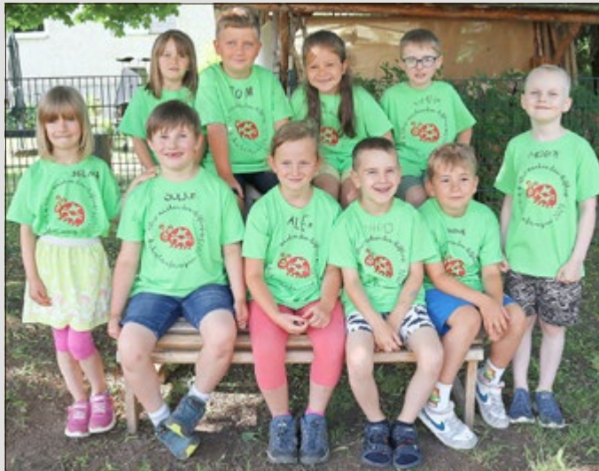
Christlicher Kindergarten „Sonnenschein“