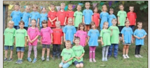
Kindertagesstätte „Kindernest Rodebach“