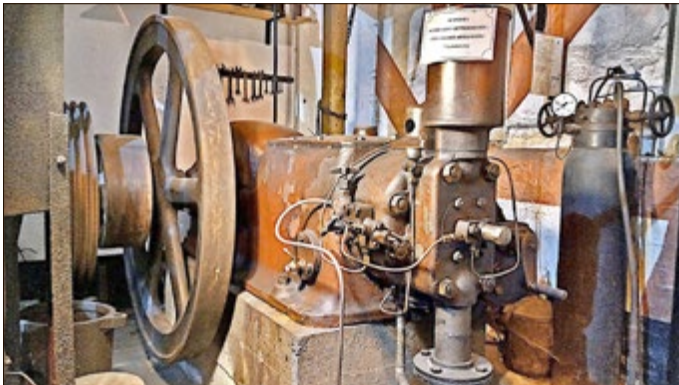
Der Deutz-Diesel-Motor, Baujahr 1935, im Technikmuseum Gesenkschmiede

Nach dem erforderlichen Stillstand des historischen Dieselmotors während der Coronaeinschränkungen auch im Museumssektor, war dieser nicht mehr funktionsfähig. Eine hilfesuchende Anfrage zur Schadensbeseitigung an die Firma FHS wurde sofort positiv entgegengenommen und kurzfristige Hilfe zugesagt.