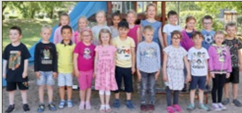
Integrativer Kindergarten „Sommerau“