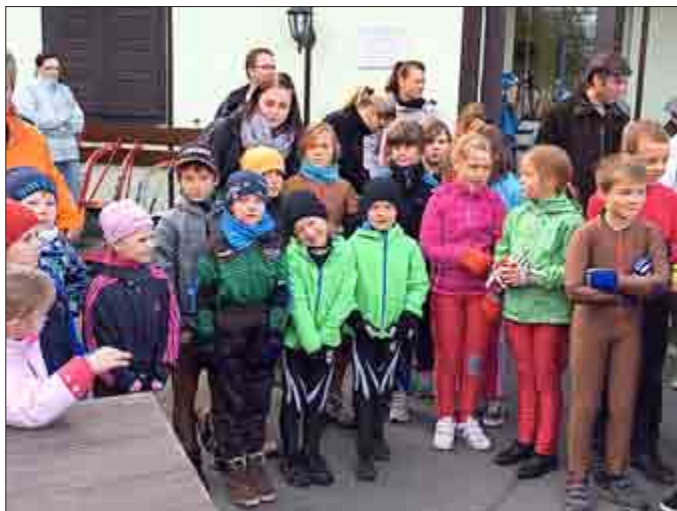
Bu: Herbstpokal Jugend E und D

Die Zella-Mehliser Rennrodler sind für den Winter gut gewapp- net. Nach den Vorbereitungen im Sommer hoffen wir in allen Al- tersklassen, in denen Zella-Mehliser Rennrodler starten auf gute Ergebnisse. Die Sportler der Jugend A bis E hatten bereits im September ihre ersten Bewährungsproben auf der Sommerro- delbahn in Ilmenau.