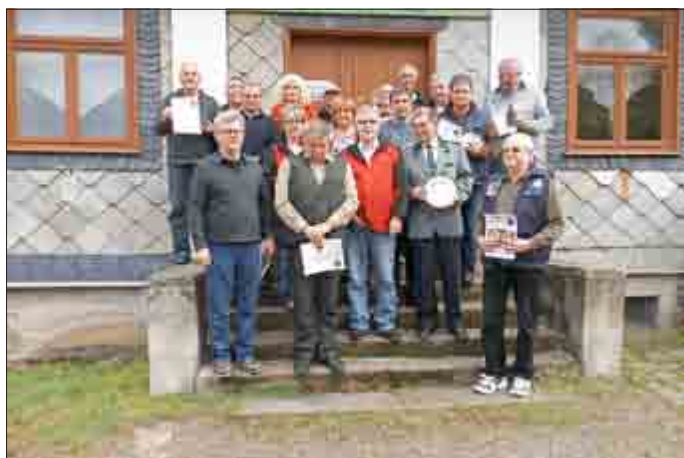
Die siegreichen Teilnehmer

vhs – Außenstelle Zella-Mehlis, Sommerauweg 27, 98544 Zella-Mehlis Tel.: 03682/482976 Fax: 03682-896331 E-Mail: anmeldung-zm@vhs-sm.de