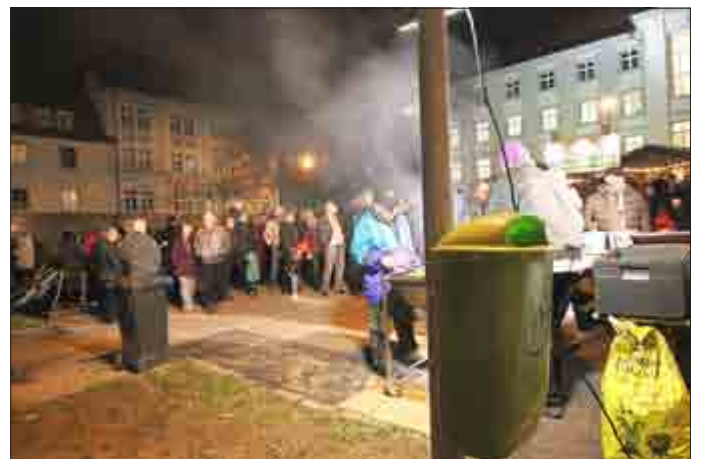
Auch 2014 war viel los auf dem Rathausparkplatz

Mit einem verkaufsoffenen Sonntag setzt der Gewerbeverein Zella-Mehlis das mittlerweile zur Tradition gewordene „ Lichterfest “ fort. Es ist nun bereits die 6. Veranstaltung. Der Erfolg und Zuspruch zu den ersten fünf Veranstaltungen lässt auch 2015 auf eine gute Resonanz in der Bevölkerung sowohl zum verkaufsoffenen Sonntag wie auch zur kleinen Abschlussveranstaltung auf dem Rathausparkplatz hoffen.