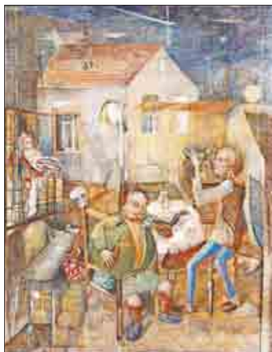
„Sommerküche“, Farbstift, 2012, 38 x 30,5 cm