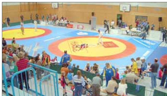
Für besondere Projekte wie den Ruppbergpokal des AV Jugendkraft/Concordia (Foto vom vergangenen Jahr) erhalten die Vereine auf Antrag Zuschüsse von der Stadt.

Außerdem erhält der Gesangverein Zella-Mehlis für eine Konzertreise der Gruppe „Vokalissimo“ 450 Euro aus den Mitteln für Städtepartnerschaften. Das Vokalensemble tritt am 21. Mai in der Partnerstadt Andernach gemeinsam mit dem dortigen Jugendorchester auf.