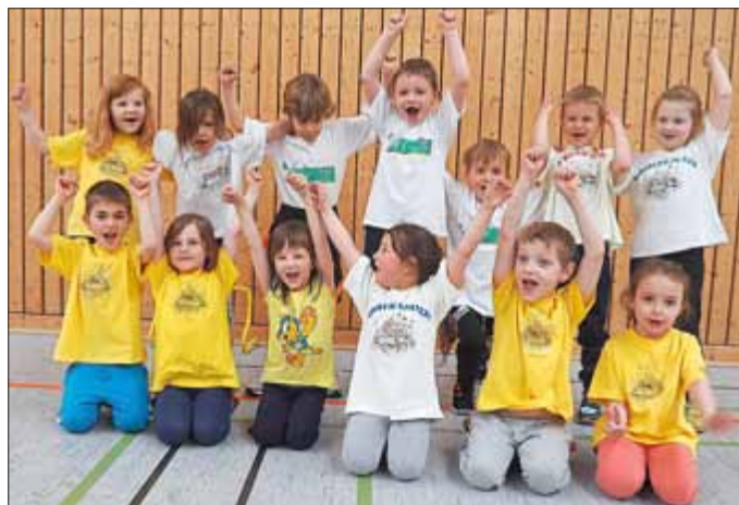
Kindergarten Ruppbergspatzen – zweimal