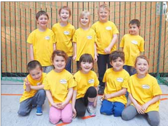
Christlicher Kindergarten Sonnenschein

Zum siebten Mal hat das Turnier bereits stattgefunden, organisiert wird es von der WSG Thüringer Wald. Ein kleines Dankeschön gab es natürlich auch für die sportlichen Erzieherinnen, die „ihre“ Kinder bereits seit Wochen auf das Turnier vorbereitet haben.