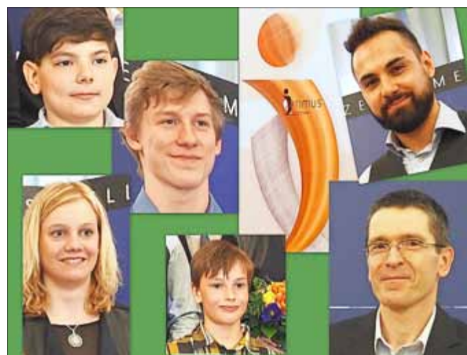
Sechs Sportler, darunter vier Rodler, haben in diesem Jahr den „Primus“ erhalten.