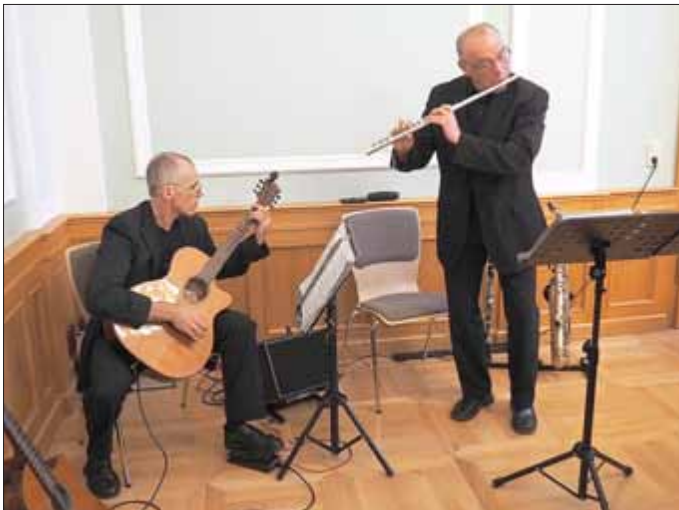
Das Duo „Jazznah“ sorgte für die musikalische Umrahmung.